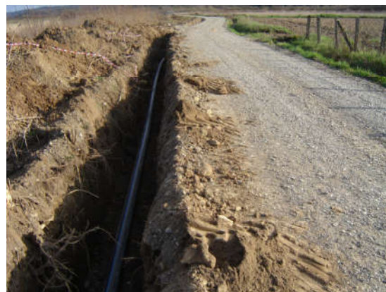
Изградња водоводне мреже

У јесен 2014. године завршена је изградња и канализационе мреже за нова насеља и у току је прикључење домаћинстава на канализациону мрежу.