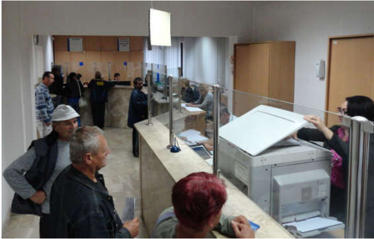
Шалтер сала општине