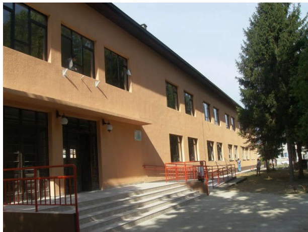
Реконструкција ОШ „Свети Сава“