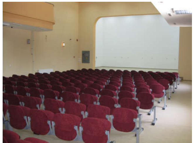
Опремљена Кино сала

У области здравствене заштите у Дому здравља Модрича извршено је уређење и опремање службе хитне помоћи и службе за физикални третман. Умјесто монтажног дијела Дома здравља изграђен објекат од чврстог материјала, укупне површине 1.250 м 2 (приземље + спрат). Вриједност ових пројеката је 626.200 КМ (Развојни програм РС 500.000 КМ и општина Модрича 126.000 КМ)