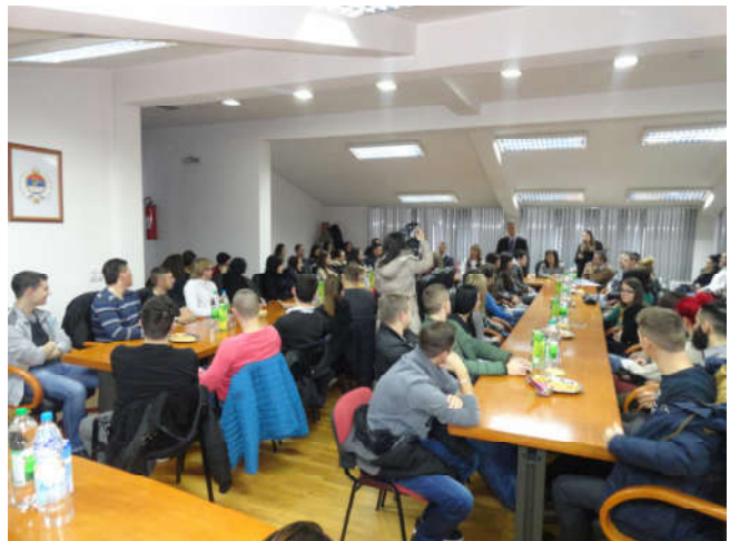
Пријем модричких стипендиста

У току 2008. године је започела реализација пројекта Омладински парламент . Циљ овог пројекта је да се подигне свијест дјеце о демократским процесима, правима и одговорностима појединаца у функционисању друштва како би се млади лакше укључили у друштвене токове. Омладински парламент је формиран у средњој школи и броји 25 парламентарараца. Сваке године се одржава сједница парламента на којој парламентарци из предложених ученичких пројеката, изаберу пројекте који ће се реализовати у тој години у оквиру планираних средстава за те намјене у