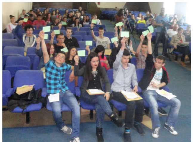
Сједница Омладинског парламента