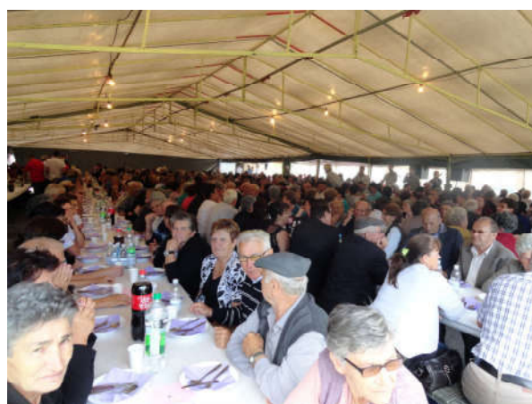
Годишње дружење пензионера у Ријечанима