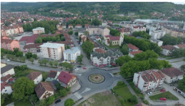
Прва кружна раскрсница у Модричи

У 2016. години, послје катастрофалних поплава из 2014. године и клизишта која су тиме проузрокована, завршена је санација свих путних праваца према Дугој њиви, а из кредита који је Влада РС по веома повољним условима од Свјетске банке прослиједила према општинама.