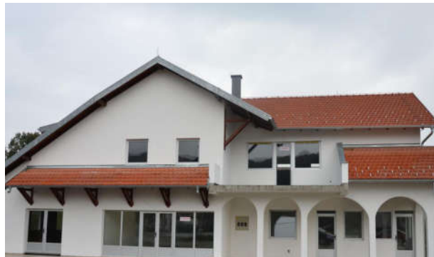
Новоизграђена зграда Мјесне заједнице Врањак I и Мјесна канцеларија

Пружање услуга у шалтер сали је прилагођено потребама и захтјевима грађана у смислу радног времена (радно вријеме без паузе и продужено радно вријеме до 16 часова, 3 дана у седмици), као и све остале услуге, копирање, административне таксе, потребни обрасци и разни захтјеви. Општинска управа је опремљена савременим рачунарима и осталом опремом, међусобно је увезана и све се обавља електронским путем.