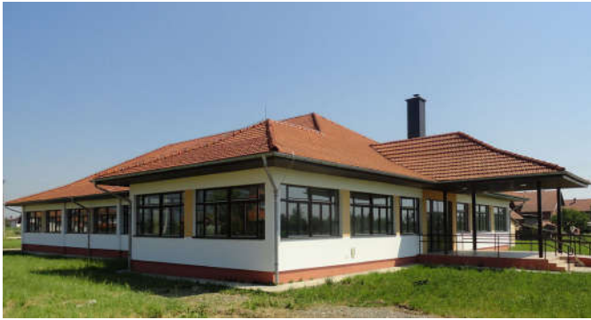
Изграђена и опремљена петоразредна школа у МЗ Модрича 5