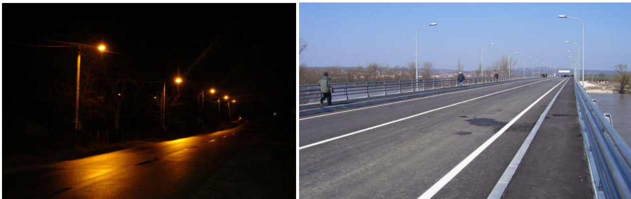
Километри нових уличних светиљки

На плану увођења уличне расвјете постављено је око 3500 уличних свјетиљки и обезбијеђено је да у свакој мјесној заједници буду освијетљени центри насеља, као и многе улице тако да улична расвјета више није само привилегија града него и људи који живе на селу.