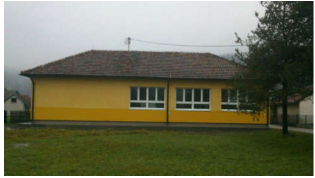
Санација и реконструкција ОШ „Свети Сава“ ПШ Бвијестово