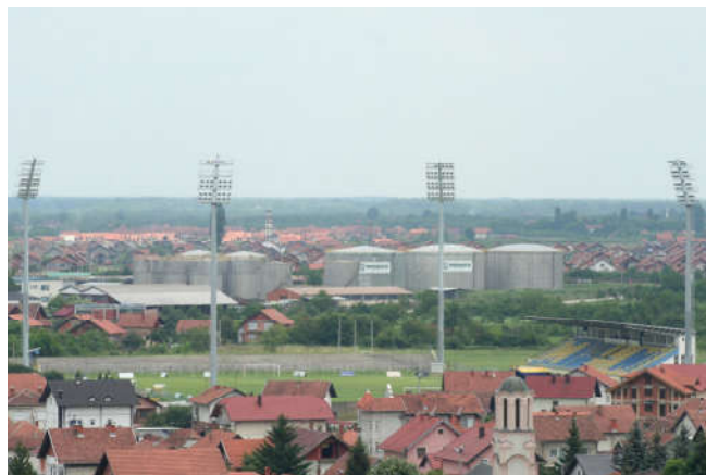
Уређен Стадион „Др Милан Јелић“