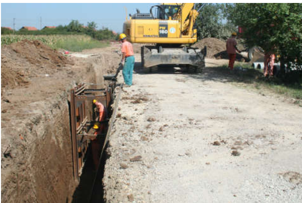
Изградња канализационе мреже

Године 2009. потписан је први уговор о изградњи 27 километара водоводне мреже и тај посао у потпуности је завршен. 2010. године завршена је изградња потисног вода који доводи питку воду у главни резервоар за воду на Мајни који је 15 пута већи од резервоара који се до тада употребљавао. Предност нове водоводне мреже у новим насељима, у односу на привремене прикључке, које су раније мјештани тих насеља користили, јесте што грађани имају квалитетније снабдијевање водом и у знатно већем капацитету, а нови потисни цјевовод и велики резервоар помажу како новим насељима тако и ужем градском простору да воду имају у довољним количинама. Од 2014. године у употреби су и два нова изворишта која су се налазила у кругу Рафинерије и тиме је ријешен проблем рестрикција воде у љетном периоду када је већа потрошња од уобичајене.