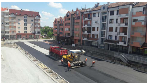
Уређење паркинг простора и интерних саобраћајница из обухвата РП "Тржница"