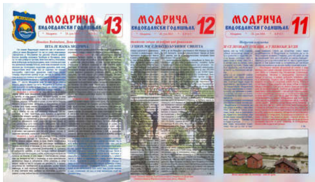
Видовдански годишњак општине