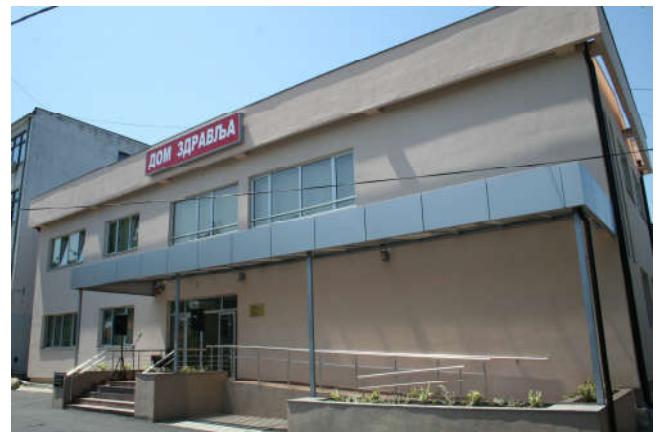
Новоизграђени објекат Дома здравља

У области здравствене заштите у Дому здравља Модрича извршено је уређење и опремање службе хитне помоћи и службе за физикални третман. Умјесто монтажног дијела Дома здравља изграђен објекат од чврстог материјала, укупне површине 1.250 м 2 (приземље + спрат). Вриједност ових пројеката је 626.200 КМ (Развојни програм РС 500.000 КМ и општина Модрича 126.000 КМ)