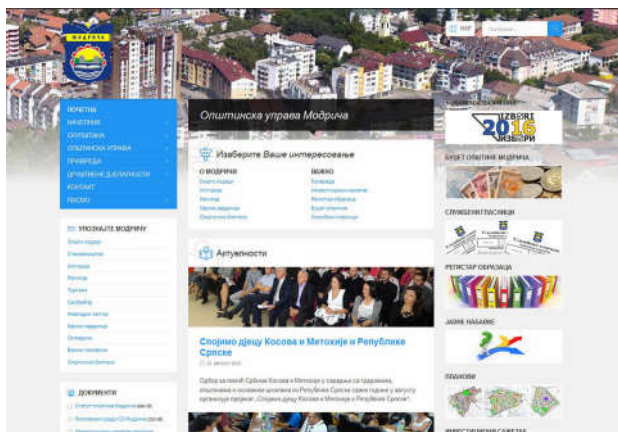
Веб страница општине

Нова тј. редизајнирана веб страница објављена је 2010. године на оба писма, да би иста 2013. године била објављена и на енглеском језику. Имајући у виду, да се у овој области стално постижу одређене новине у самом изгледу, начину постављања и претраживања, 2016. године поводом Дана општине – Видовдана објављена је поново најновија веб страница која је технички и дизајнерски напреднија у односу на претходну. Страница је објављена на ћириличном и латиничном писму, а у изради је и верзија на енглеском језику. Дневно је ажурна и извор је информација за велики број грађана широм свијета, а само у 2015. години страницу је посјетило 81700 посјетилаца.