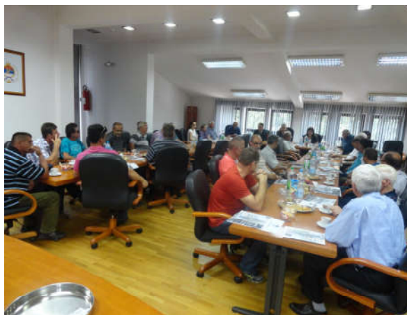
Пријем представника Удружења протеклог одбрамбено-отаџбинског рата

Поред пружања финансијске помоћи ППБ и РВИ, од 2005. године у име Начелника општине Модрича у поводу Дана општине – Видовдана редовно се врше посјете свих ППБ и РВИ I категорије.