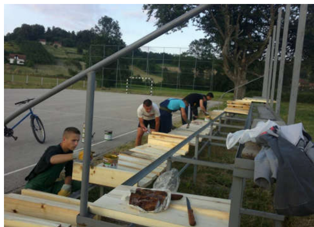
Изградња Мини трибина у Кутловцу