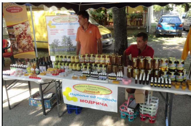
Сајам меда и пчеларства