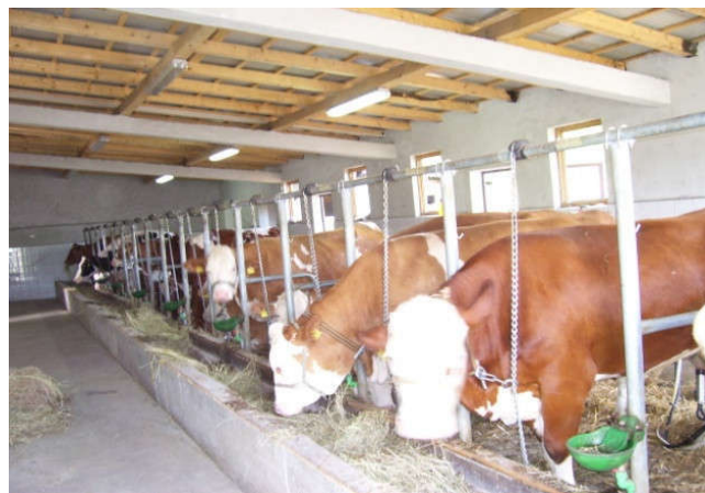
Фарме на подручју општине Модрича