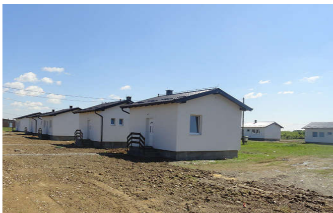
Изградња кућа породицама чије домове су уништила клизишта

У наредном периоду општина Модрича планира: