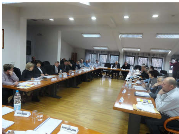
О Буџету на сједници СО Модрича

Буџет је у потпуности стабилизован, све преузете обавезе су измирене, издвајања за буџетске кориснике и кориснике грантова су на знатно вишем нивоу, извршена су знатна улагања у реализацију капиталних пројеката и остварен висок степен ликвидности. Морамо нагласити и транспарентност код усвајања буџета, као и извјештавања о располагању буџетским средствима. Организују се јавне расправе на тему буџета на којима се грађанима презентују остварени резултати и планови за наредну годину. На овим расправама грађани имају прилику да изнесу своје примједбе, приједлоге и сугестије и многи од ових приједлога су уврштени у буџет и реализовани.