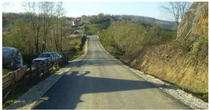
Путеви према Дугој њиви

Из горе наведеног видљиво је да на територији општине Модрича има око 500 км путева због чега наша општина спада у ред локалних заједница које имају веома разгранату путну мрежу. Од 2004. године велики број путева и улица је асфалтиран, а највећу корист од тога имају грађани, посебно из сеоских мјесних заједница јер је свака повезана са градом асфалтним путем. Захваљујући томе, данас људи из најудаљенијих дијелова општине за петнаестак минута возилом стигну у центар града. Врхунац свега било је асфалтирање свих приступних путева према Дугој њиви и Липи у дужини од око 50 км.