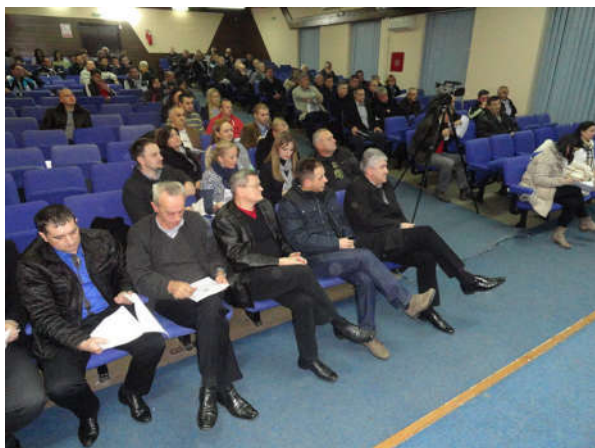
Јавна расправа о Нацрту буџета

Изградњом фудбалских свлачионица и спортских полигона су створене значајне претпоставке за развој спорта на подручју општине, а у наредном периоду се тиме омогућава веће улагање у финансирање текућих потреба спортских клубова (набавка спортске опреме, трошкови такмичења и сл.). За врло битан резултат сврсисходног трошења буџетских средстава, сматрамо и податак да је у посматраном периоду дошло до стварања низа удружења грађана у области културе (културно умјетничка друштва, мажореткиње, етно група и др.) и уопште до развоја невладиног сектора.