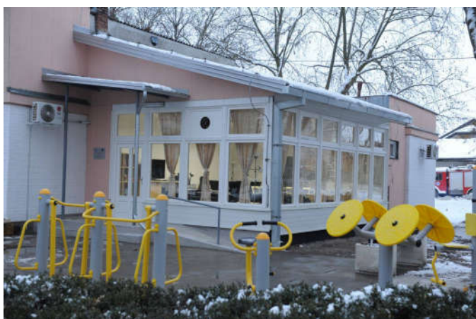
Центар за здраво старење

Кроз УН-ов програм за опоравак од поплава под називом „Данас за нас“ у Дому пензионера је отворен Центар за здраво старење . Реновиране су просторије, набављен намјештај, справе за вјежбање и друга опрема и извршена обука волонтера, који ће водити центар и пружати одређене услуге корисницима центра, вриједност пројекта је око 60.000 КМ. Циљ пројекта је побољшање квалитета живота особа треће животне доби. Општина Модрича, поред износа од 40.000 КМ које у просјеку издваја годишње пензионерима, формирањем оваквог центра спада у ред општина која овој популацији придаје велику пажњу.