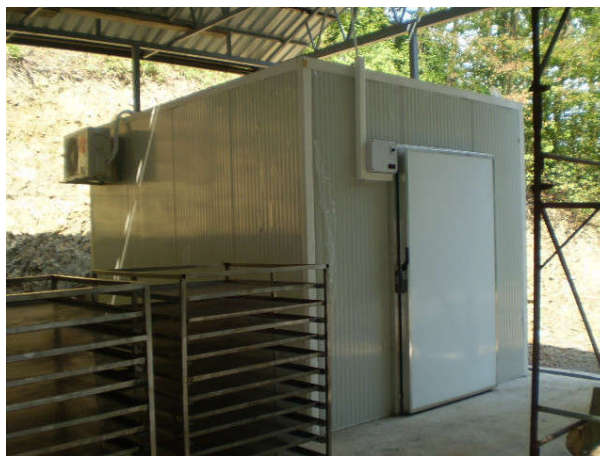
Објекат и и хладњача Пословно-предузетничког центра Јабучик