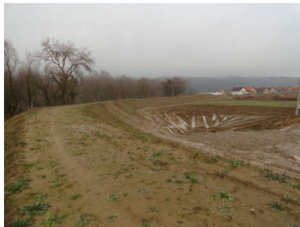
Одбрамбени насип у насељу Добор у МЗ Модрича 4