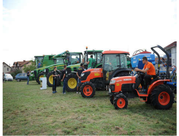
Сајам привреде и сеоског предузетништва

Такође, увели смо низ других новина којима се олакшала и поједноставила регистрација привредних субјеката и приступ информацијама, од увођења брзе процедуре (регистрације за један дан), смањење такси, затим оснивање Инфо центра за инвеститоре при Развојној агенцији општине Модрича, штампање разних брошура и инвестиционих сажетака.