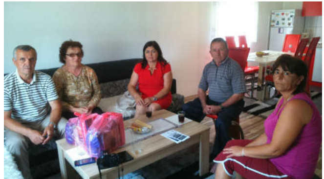
Изграђена зграда „24 стана“ за ППБ и РВИ Обилазак породица ПБ поводом Видовдана – Дана општине

У сарадњи са Министарством рада и борачко-инвалидске заштите заједничким средствима купљена су два стана за двије ППБ у износу од 85.000 КМ. Из Фонда напуштене имовине, након што су враћени општини Модрича, додијељена су четири стана за четири ППБ. Такође, за три ППБ додијељене су три монтажне кућице, које су од Владе Републике Српске пренесене на општину Модрича, а изграђена је и 1 кућа за логораша у вриједности од 41.025,88 КМ.