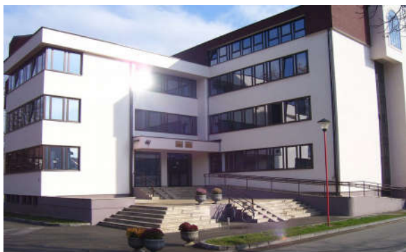
Опремљена и усељена нова зграда Општине

Изграђена је, опремљена и усељена Мјесна канцеларија у Врањаку и адаптиране мјесне канцеларије у Дугом Пољу и Скугрићу.