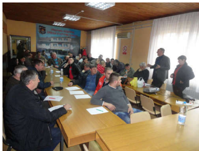
Зимска школа за пољопривреднике

Ове године након одслушаних предавања 45 пољопривредних произвођача је од Министарства пољопривреде, шумарства и водопривреде - Ресор за пружање стручних услуга добило сертификат Фармер - произвођач млијека као неопходан услов за добијање Еуро-броја.