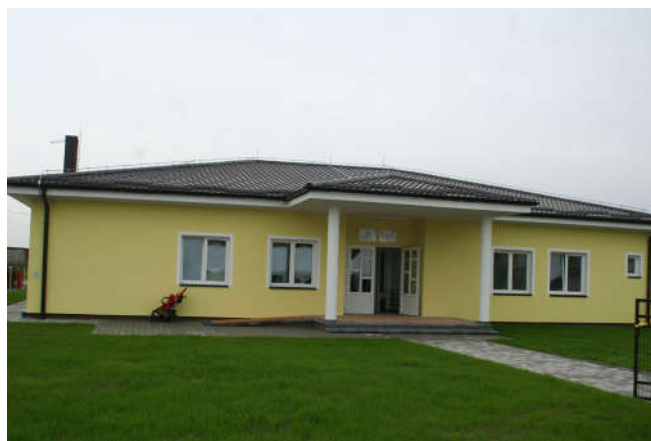
Центар за дневни боравак дјеце са посебним потребама

Општина Модрича је неколико година уназад улагала изузетне напоре да пронађе неопходна средства за изградњу Центра за дневни боравак дјеце са посебним потребама . Напокон 2015. године пронађен је донатор и изграђен је и опремљен приземни објекат корисне површине 276,41 м 2 , чија је укупна вриједност 551.329 КМ. Средства за изградњу и опремање Дневног центра је обезбиједило Удружење Обервалис из Швајцарске у износу од 489.957 КМ, док је општина Модрича финансирала и обезбједила адекватну парцелу величине 1.125 м 2 те сву потребну пратећу документацију, дозволе и прикључке у износу од 61.372 КМ.