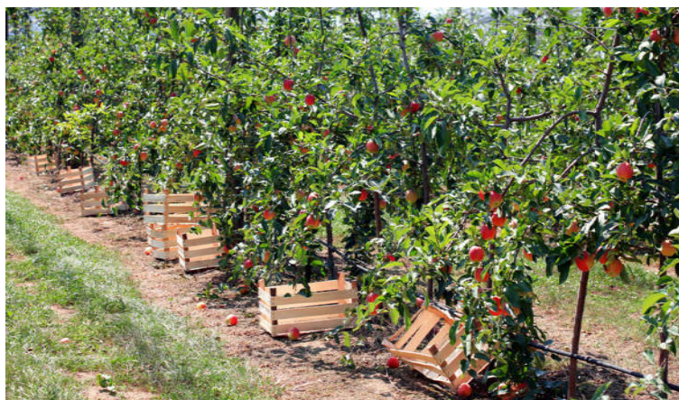
Подстицаји за садњу воћа

У овој производњи знатно је унапредовала технологија производње захваљујући одржавању зимских школа за пољопривредне произвођаче гдје су ангажовани стручњаци из ове области. Посебно треба издвојити пројекат Унапређење воћарске производње на подручју општине Модрича гдје је у сарадњи са Пољопривредним институтом Бања Лука засновано 1,2 хектра воћњака код 6 пољопривредних произвођача. Значај овог пројекта је у томе што су ови воћњаци засновани према свим препорукама струке и надзором стручњака из Института. Вриједност овог пројекта је 10.000 КМ.