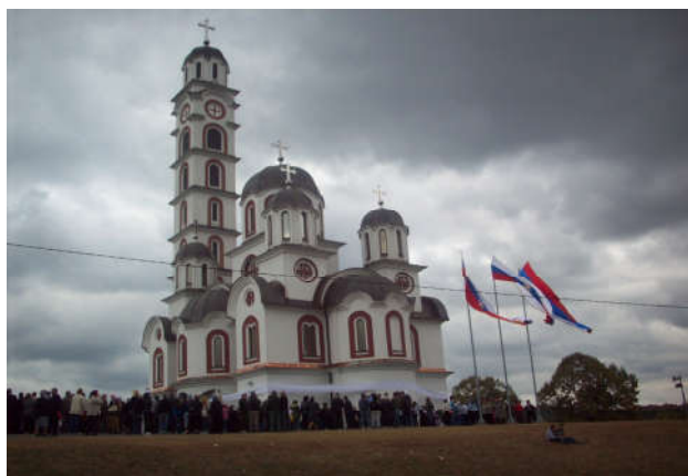
Завршена изградња Цркве у Вишњику