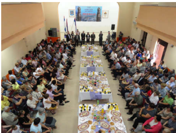
Пријем ППБ и РВИ поводом Видовдана – Дана општине

Првобитно приоритет је било школовање и стамбено збрињавање дјеце и ППБ и РВИ од I до IV категорије. Последњих година, приоритет по Општинској одлуци о допусним правима је побољшање положаја бораца ВРС и ратних војних инвалида нижих категорија од V до X категорије, као што су новчане помоћи за увођење и прикључак воде и струје, право на стамбено збрињавање, болничко и бањско лијечење и накнаде на име сахрана. Поред наведене одлуке Начелник општине је по указаној потреби донио одлуку да се свим ППБ одобри додатна помоћ за прикључак на канализациону мрежу, као и помоћ за најугроженије породице за пркључак на водоводну мрежу.