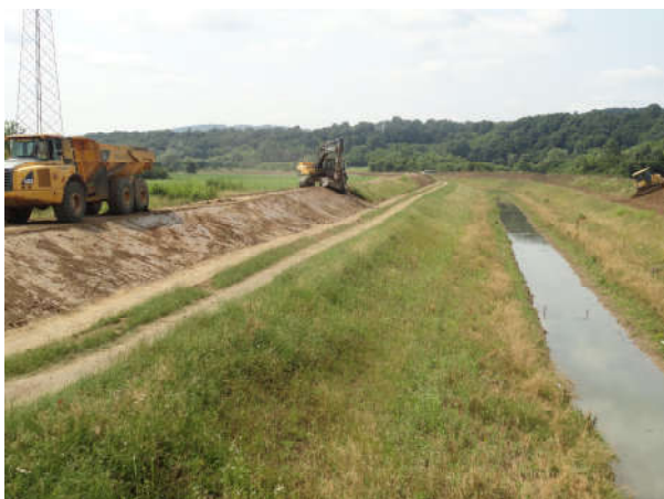
Реконструкција западног латералног канала

Јавна Установа «Воде Републике Српске», а на иницијативу општине Модрича, 2015. године завршили су комплетну реконструкцију Западног латералног канала са притокама Срнава, Толиса и Добриња и тај пројекат је износио око 2,2 милиона конвертибилних марака.