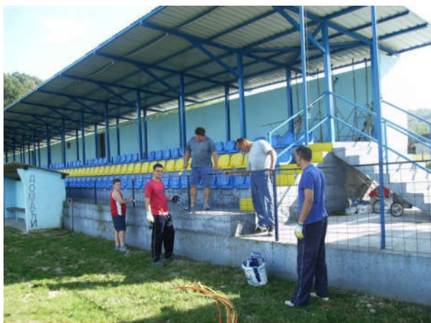
Санирање заштитне ограде на Стадиону ФК „Врањак“