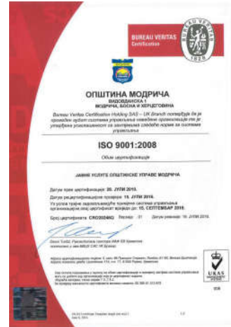
Сертификат ИСО 9001:2008

Стога је, радећи на овакав начин, општина Модрича постала препознатљива по модерној управи заснованој на принципима отворености, ефикасности, професионалности и партиципацији грађана у процесу доношења одлука.