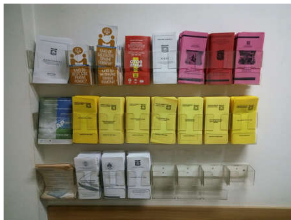
Брошуре и леци