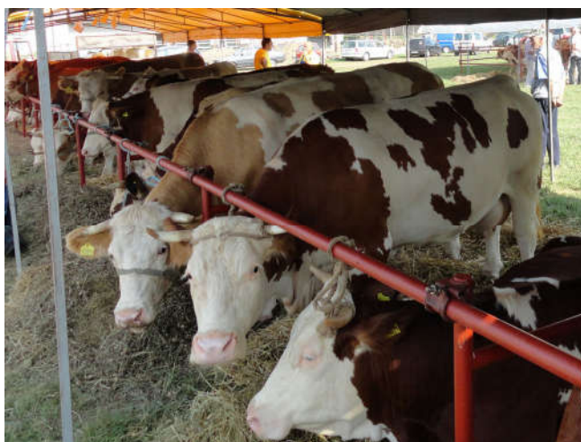
Изложба стоке на Сајму привреде и сеоског предузетништва у Модричи

Изложба стоке (музних грла и подмлатка) је посебно привукла пажњу како домаћих стручњака тако и страних. Према оцјенама страних стручњака изложена грла су високог квалитета и потенцијала тако да треба покушати да ова Изложба постане регионална, а по квалитету грла заслужује да буде и републичка.